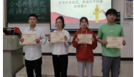
▲朗诵,合唱活动现场

中国社会主义青年团是信仰马克思主义的革命组织。中国社会主义青年团第一次全国代表大会的召开,使中国社会主义青年团实现了思想上、组织上的完全统一,成为在政治纲领和奋斗目标上与中国共产党保持一致的全国性的先进青年组织。由此,中国青年团组织正式诞生了,这是中国青年运动发展史上的一个里程碑。