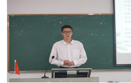
▲求职大赛参赛选手演讲

(高职二学部)为提高大学生的文化素质,丰富校园生活,高职二学部在2022年5月5日晚于2B402举办了求职大赛,真实模拟大学生求职的经历,使同学们在校园学习中提前体会求职的历程。增强学生表达交流及思考辩论能力,锻炼胆量,提高眼界。