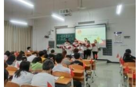
▲朗诵,合唱活动现场