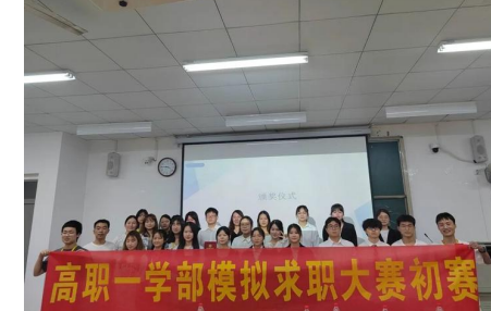
▲模拟求职大赛活动现场

——高职一学部举办模拟求职大赛(高职一学部)为了让大学生在社会主义市场经济制度条件下,树立自主择业的意识、发挥个人的优势,我部举办了模拟求职大赛。2022年5月6日晚,高职一学部于1B101举行了2022年模拟求职大赛初赛,由相关部门部长和老师担任评委。各位选手在比赛中展示自我,挑战自我,完善自我。树立正确的就业观念,提升就业能力是本次大赛的初衷。现场的评委老师们对所有参赛选手给予肯定,并且进行精彩的点评,使现场观摩的同学在同辈的表现和前辈的评委的点评中获益良多。