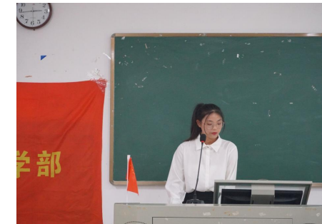
▲求职大赛参赛选手演讲

最后,本次求职大赛也顺利落下帷幕。本次大赛的出发点是“提前演练、领秀职场”,为同学们提供了一个锻炼和展示自己的平台,为未来的就业积蓄了能量。